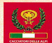
Via Silvio Pellico, 18 Cividale del Friuli