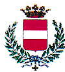
Comune di Cividale del Friuli