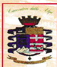
Via Silvio Pellico, 18 Cividale del Friuli

Fondata dall'Eroe dei Due Mondi in Roma l'8 maggio 1871 Ente Morale R.D. 28.02.1899